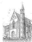
Parochie O.L.V. Onbevleekt Ontvangen Zenderen